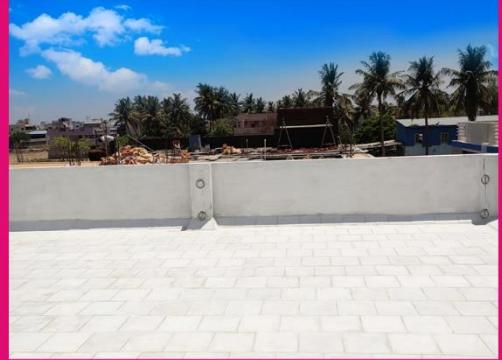
லூனி டைல்ஸ் - ஐ கையாளும் முறைகள்

லூனி டைல்ஸ் - ஐ சரியான முறையில் ஒன்றன் மீது ஒன்றாக செங்குத்தாக அடுக்கி வைக்க வேண்டும். படுக்கை வாட்டத்தில் அதிகப்படியான டைல்ஸ் பாக்கஸ்- ஐ அடுக்கினால் உடையும் வாய்ப்பு உள்ளது. இம்முறையை தவிர்ப்பது நல்லது.